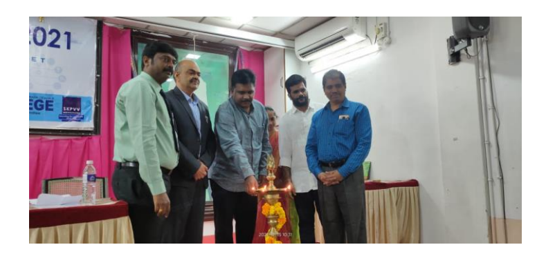
Lighting of the lamp