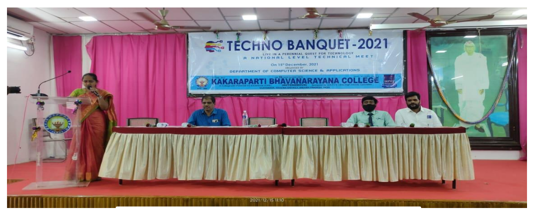
Vote of Thanks