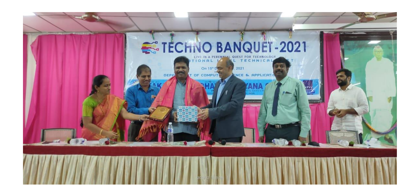
Felicitating the Guest